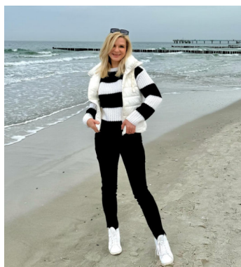
Auch wenn's noch etwas frisch war ... Ostsee geht immer!!!

Gern erinnern wir uns an das erlebnisreiche Fanclubtreffen in Dresden im März 2015. Ein kleiner Rückblick mit dem Wunsch, in 2025 wieder eines zu erleben.